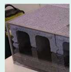
ブロック式貯留材

プラットフォームブースでは、代表的な要素技術（雨水浸透・緑化技術）がわかる模型を展示しています。