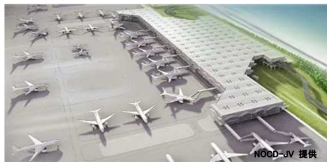
▲第3ターミナル完成イメージ