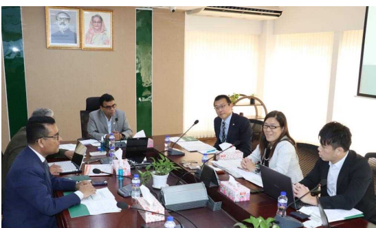
▲第1回ワーキングレベル会合の様子