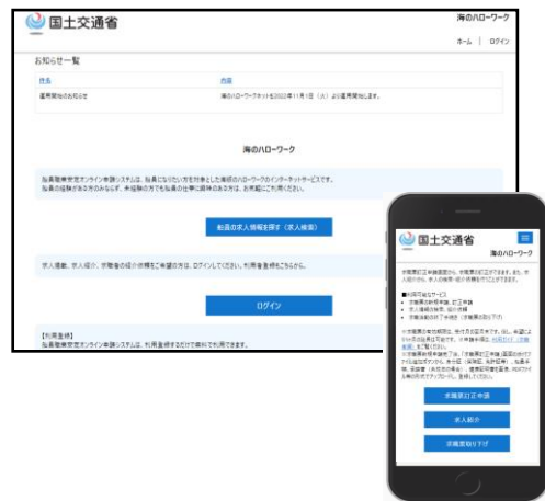
＜海のハローワークネット画面例＞