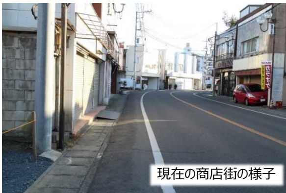
現在の商店街の様子