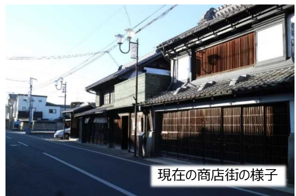
現在の商店街の様子

今後のまちづくりについてお悩みの場合には、お気軽に以下のお問い合わせ先までご相談ください。