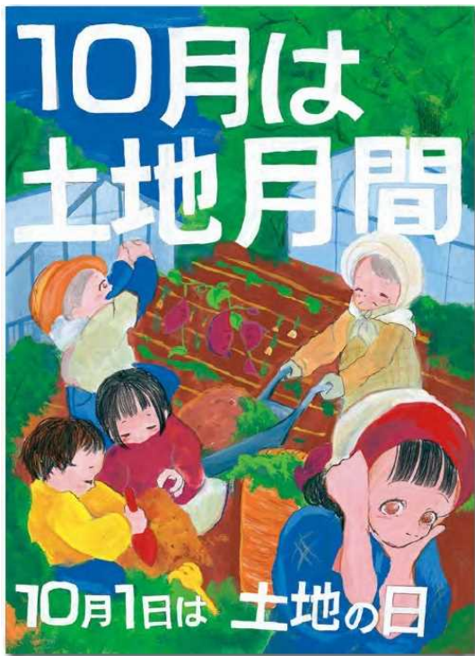
ポスター 作者/小川 優さん 【兵庫県】