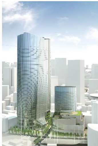
（仮称）赤坂二・六丁目地区開発計画完成イメージ