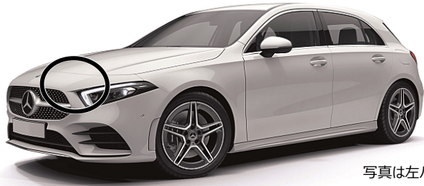
写真は左ハンドル仕様車