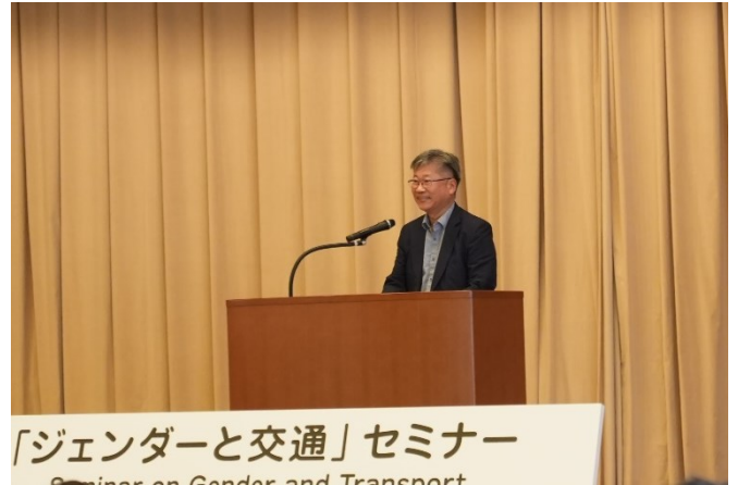
(ITF キム事務局長による来賓挨拶)