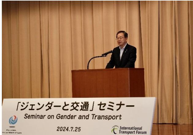
(齊藤大臣による開会挨拶)