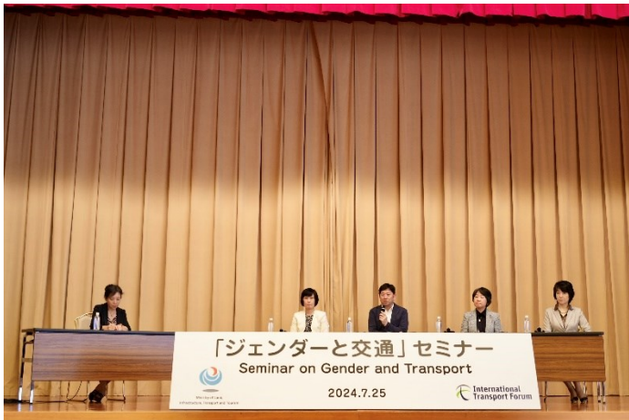
(パネルディスカッションの様子)