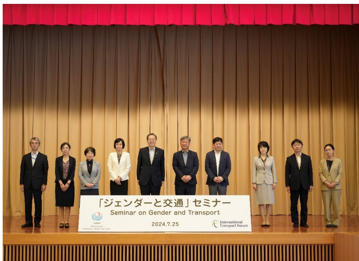
(登壇者の集合写真)

https://www.mlit.go.jp/kokusai/kokusai_tk1_000023.html