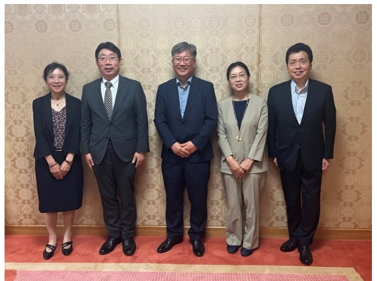
(ITF キム事務局長と水嶋国土交通審議官、寺田国土交通審議官の会談)