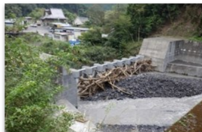
静岡県静岡市葵区入島で発生した土石流等（静岡県静岡市葵区）

・また、10都府県で182件（土石流等：55件、地すべり：2件、がけ崩れ：125件）、特に静岡県において167件の土砂災害が発生し、住家被害等に甚大な被害が発生した。