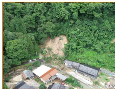
がけ崩れの被害状況 (石川県小松市中ノ峠町)