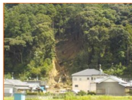
静岡県磐田市平松で発生したがけ崩れ（静岡県磐田市）