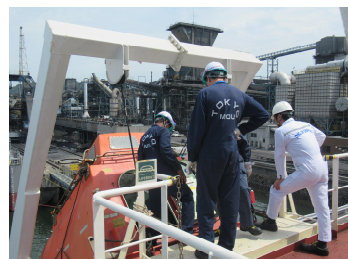
過年度の研修における講習及びPSC実地訓練の様子