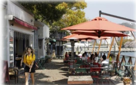
オープンカフェの設置 (京橋川／広島市)