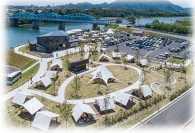
賑わい拠点の整備 (木曾川／美濃加茂市)