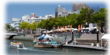
親水護岸の利用 (新町川／徳島市)