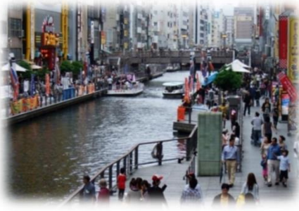
遊歩道の民間活用 (道頓堀川／大阪市)