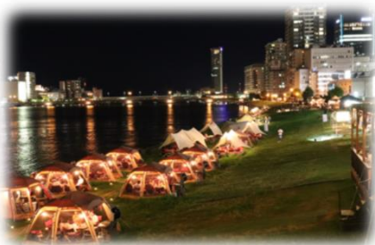
民間事業者の参加 (信濃川／新潟市)