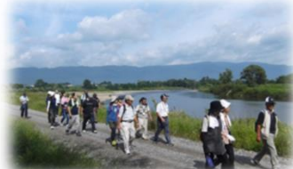
河川管理用通路の利用 (最上川／長井市)