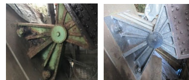
従来技術では施工困難だった部位のレーザー照射による処理例