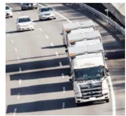
トラックの後続無人隊列走行