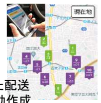
AIを活用した配送ルート自動作成