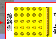
視覚障害者誘導用ブロック