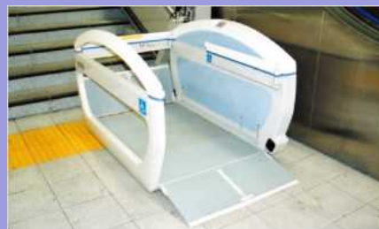
車椅子用階段昇降機