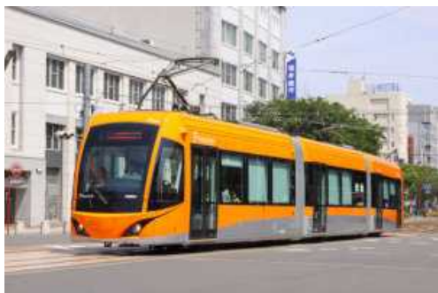
<低床式車両の導入>