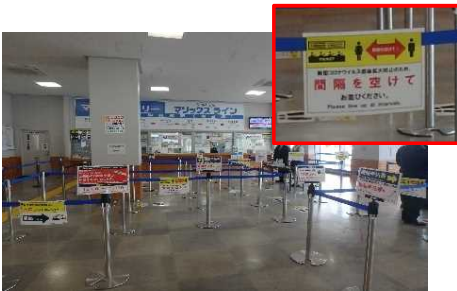
ターミナル等の衛生対策