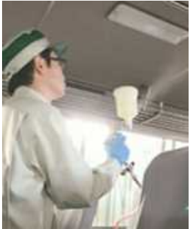
車内の抗菌・抗ウイルス対策