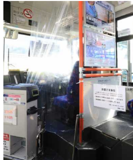
バス運転席仕切りカーテン