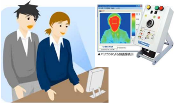
熱感知カメラ設置による感染者の公共交通利用自粛励行