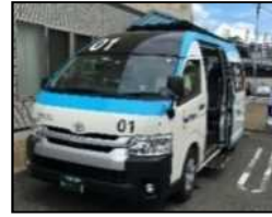
AIオンデマンド交通