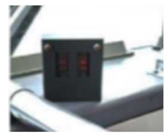
乗降データによる効率的な運行