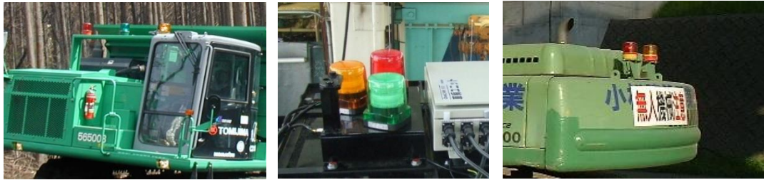
写真 5.1 自動建設機械の表示灯の例