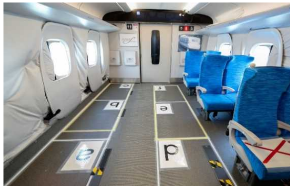
実証実験(8月3日)におけるN700S試験車両のレイアウト(車椅子スペース6席)