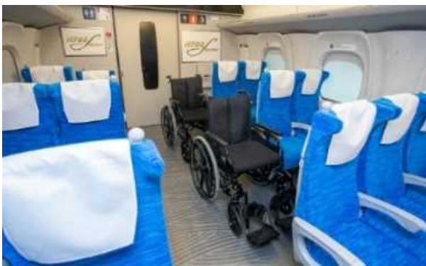
現行のN700S(車椅子スペース2席)

※2)車両の構造上の理由等により「隣接」とすることが困難な場合は「近接」も可とする