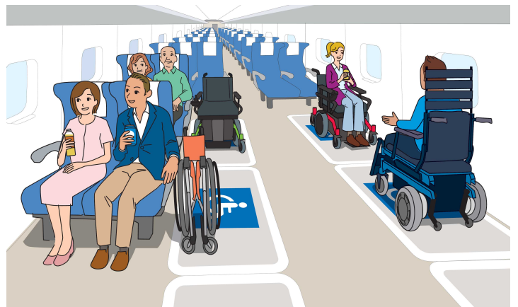
「車椅子用フリースペース」のイメージ

(移動等円滑化基準の全般に関すること) 担当者:総合政策局安心生活政策課 川口、藤井 電話:03-5253-8111 (内線 25503、25513) 直通:03-5253-8306 FAX:03-5253-1552 (移動等円滑化基準の鉄道に関すること) 担当者:鉄道局技術企画課 早川、吉田、猪木 電話:03-5253-8111 (内線 40702、40744) 直通:03-5253-8546 FAX:03-5253-1634