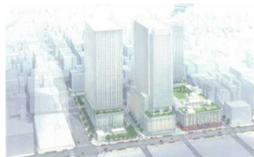
日本橋二丁目地区(東京都中央区) 容積率:800%、700% → 1990% 等

都市再生に貢献し土地の高度利用を図るため、都市再生緊急整備地域内において、既存の用途地域等に基づく規制にとらわれず自由度の高い計画を定めることにより、容積率制限の緩和等が可能。