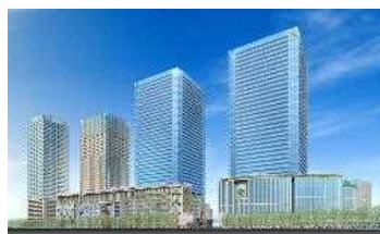
大阪駅北地区(大阪市) 容積率:800% → 1600% 等