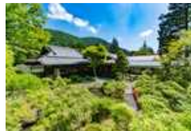
富士屋ホテル別館「菊華荘」 (旧宮ノ下御用邸) 管理者：富士屋ホテル(株)