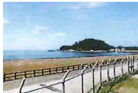
沼津御用邸記念公園からの奥駿河湾の眺め