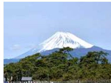
沼津御用邸記念公園 管理者：沼津市 指定管理者：(株)呉竹荘・(株)日比谷アメニス