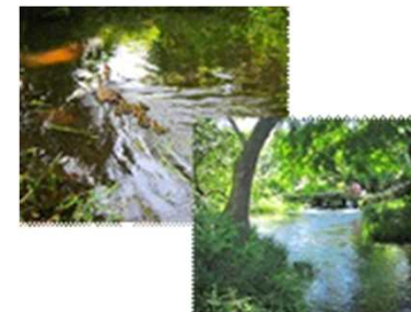
三島市立公園楽寿園 管理者：三島市