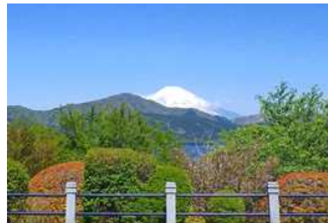
往時の箱根離宮西洋館礎石からの眺望