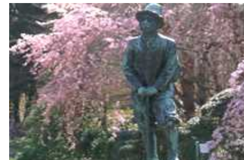
昭和天皇陛下より贈られた登山服姿の秩父宮殿下銅像とシダレザクラ