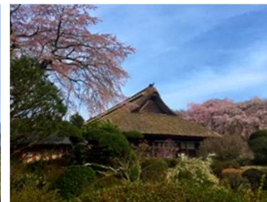
秩父宮記念公園 管理者：御殿場市 指定管理者：御殿場総合サービス(株)