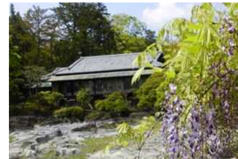
満開のフジ越しの楽寿館