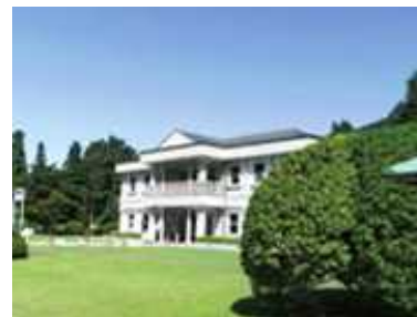
恩賜箱根公園 管理者：神奈川県 指定管理者：(公財)神奈川県公園協会・(株)ランドフローラ