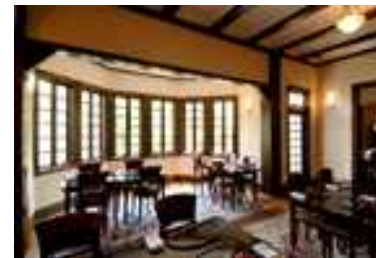
強羅花壇・懐石料理花壇 (旧閑院宮御別邸) 管理者：強羅花壇